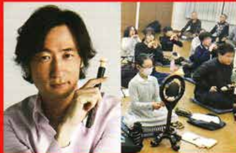
東儀秀樹 × 岡崎葵雅楽団