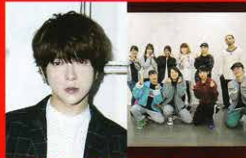
ユナク × 選抜エナジーダンサー