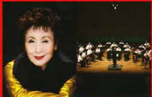
加藤登紀子 × 岡崎マンドリンアンサンブル