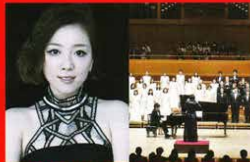
平原綾香 × 岡崎混声合唱団