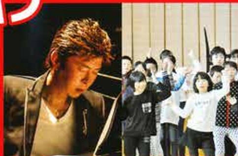
Sin × エナジーフェスキッズ合唱団

メインステージにて地元・岡崎の音楽家たちがアーティストと奇跡のコラボレーション！アーティスト同士の豪華コラボレーションも満載！必見です！